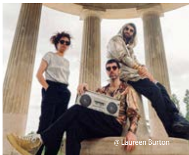
@ Laureen Burton

2025 wurde Khoury mit dem Prix Django Reinhardt als „Bester Jazzmusiker des Jahres“ ausgezeichnet und ist aktuell für die Victoires du Jazz Awards nominiert.